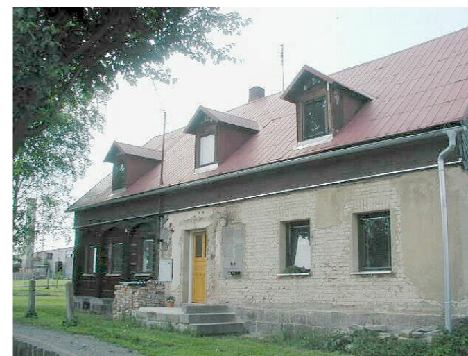
Staré Křečany č. p. 475 - Pohled na objekt