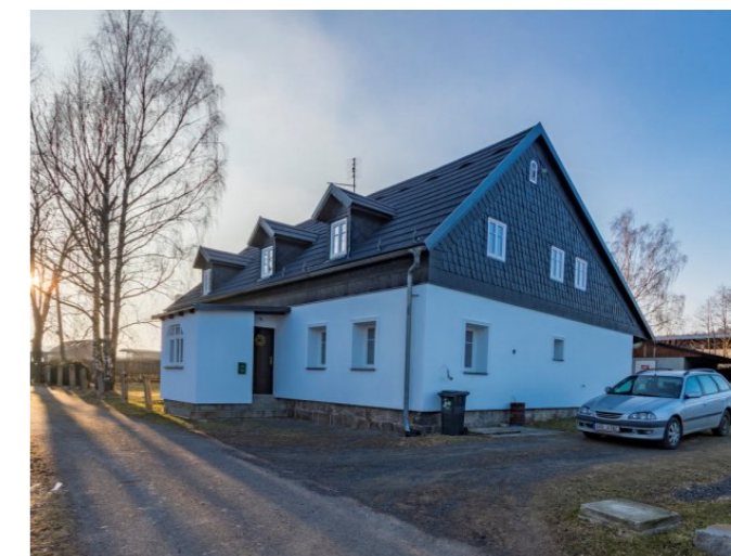
Staré Křečany č. p. 475 - Pohled na objekt (Zdroj: S. Šulcová, 2018)