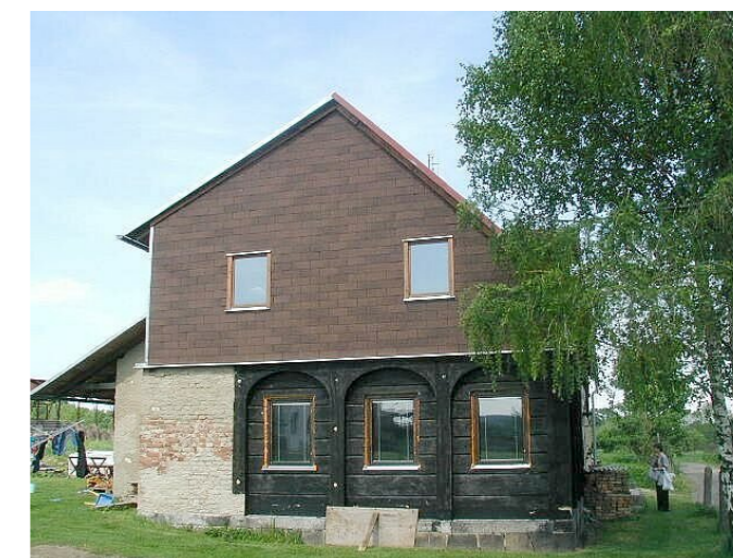
Staré Křečany č. p. 475 - Pohled na objekt