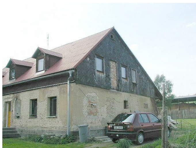
Staré Křečany č. p. 475 - Pohled na objekt