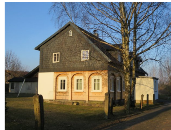
Staré Křečany č. p. 475 - Pohled na objekt