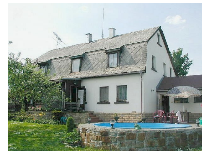
Staré Křečany č. p. 436 - Pohled na objekt