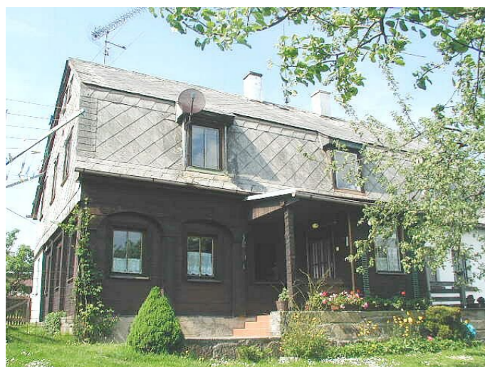
Staré Křečany č. p. 436 - Pohled na objekt