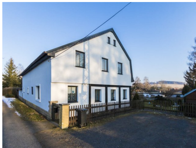
Staré Křečany č. p. 436 - Pohled na objekt